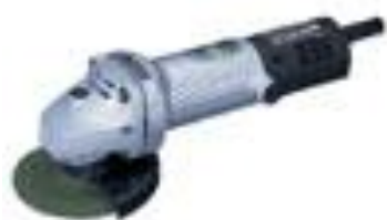
ディスクグラインダ